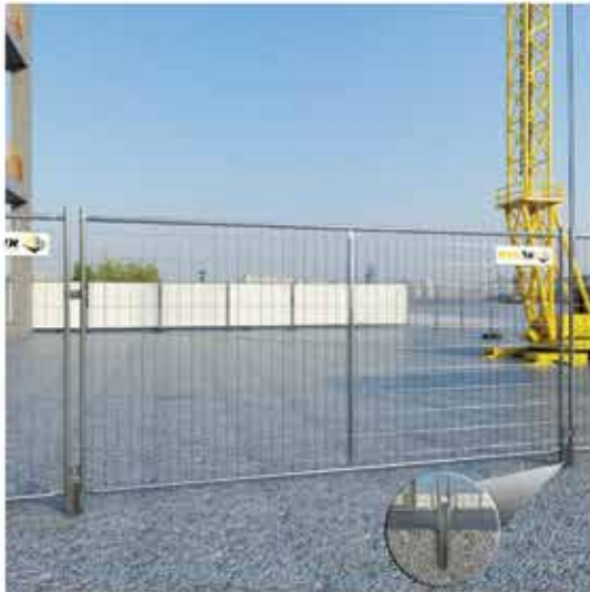
זווית נעימה לגדר ניידת