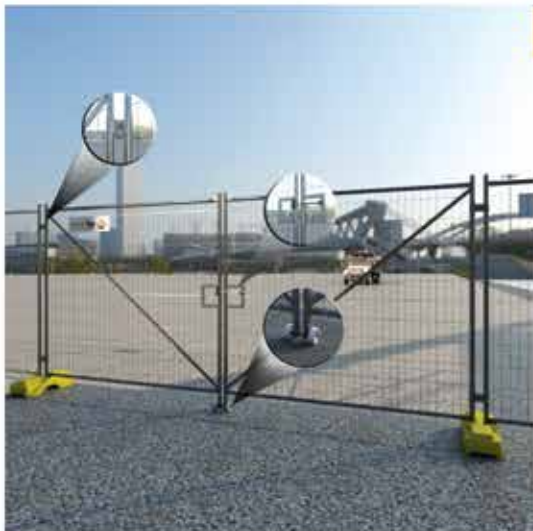
שער כפול לרכב

פתרון אידיאלי כאשר לא ניתן להשתמש בבסיס PVC.