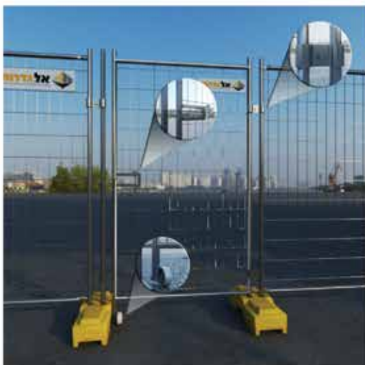
שער יחיד להולכי רגל